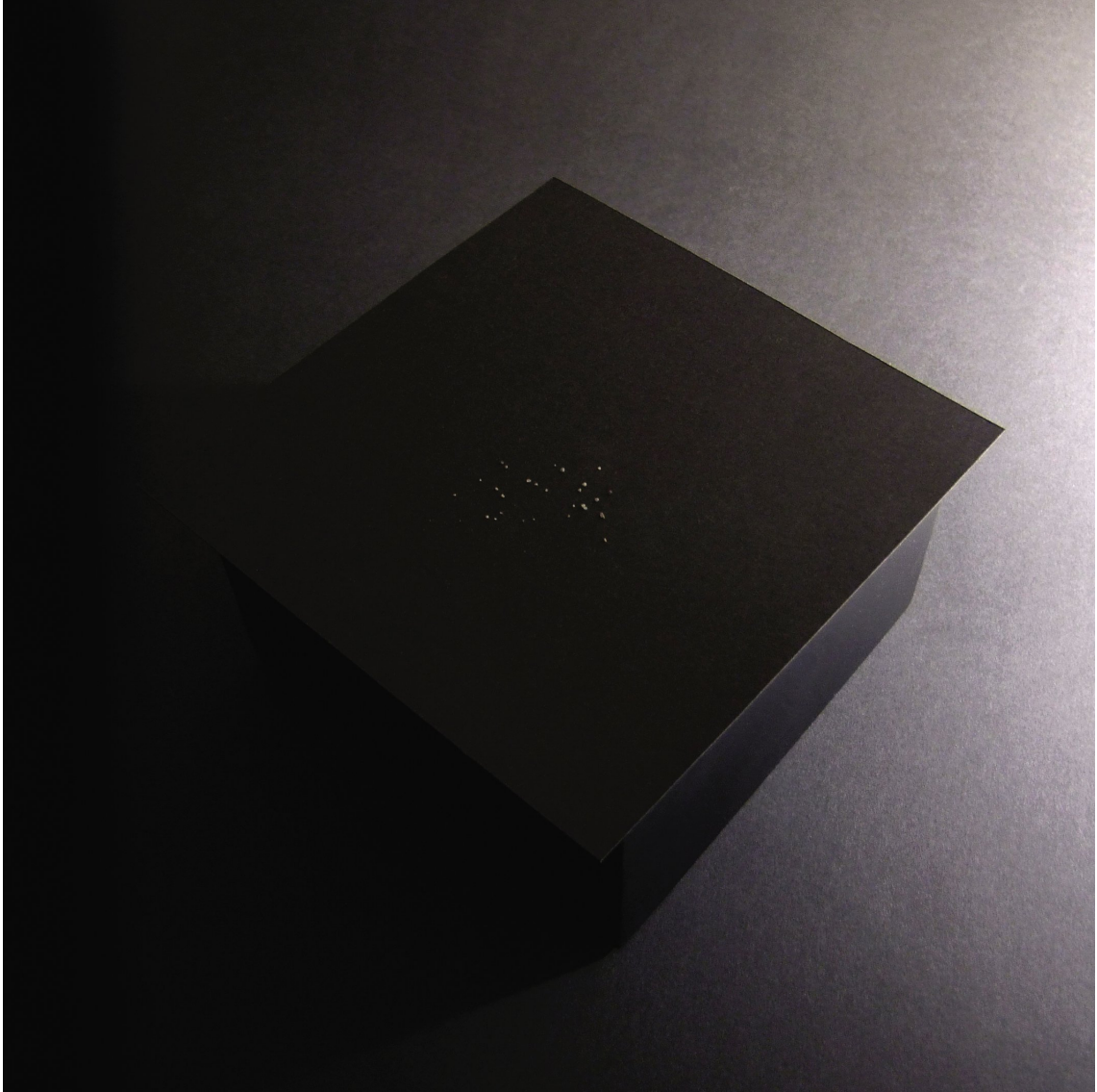
Caisson vibrant exposé à la Villa Henry : 3 Poussiérines , bois, papier, sable.