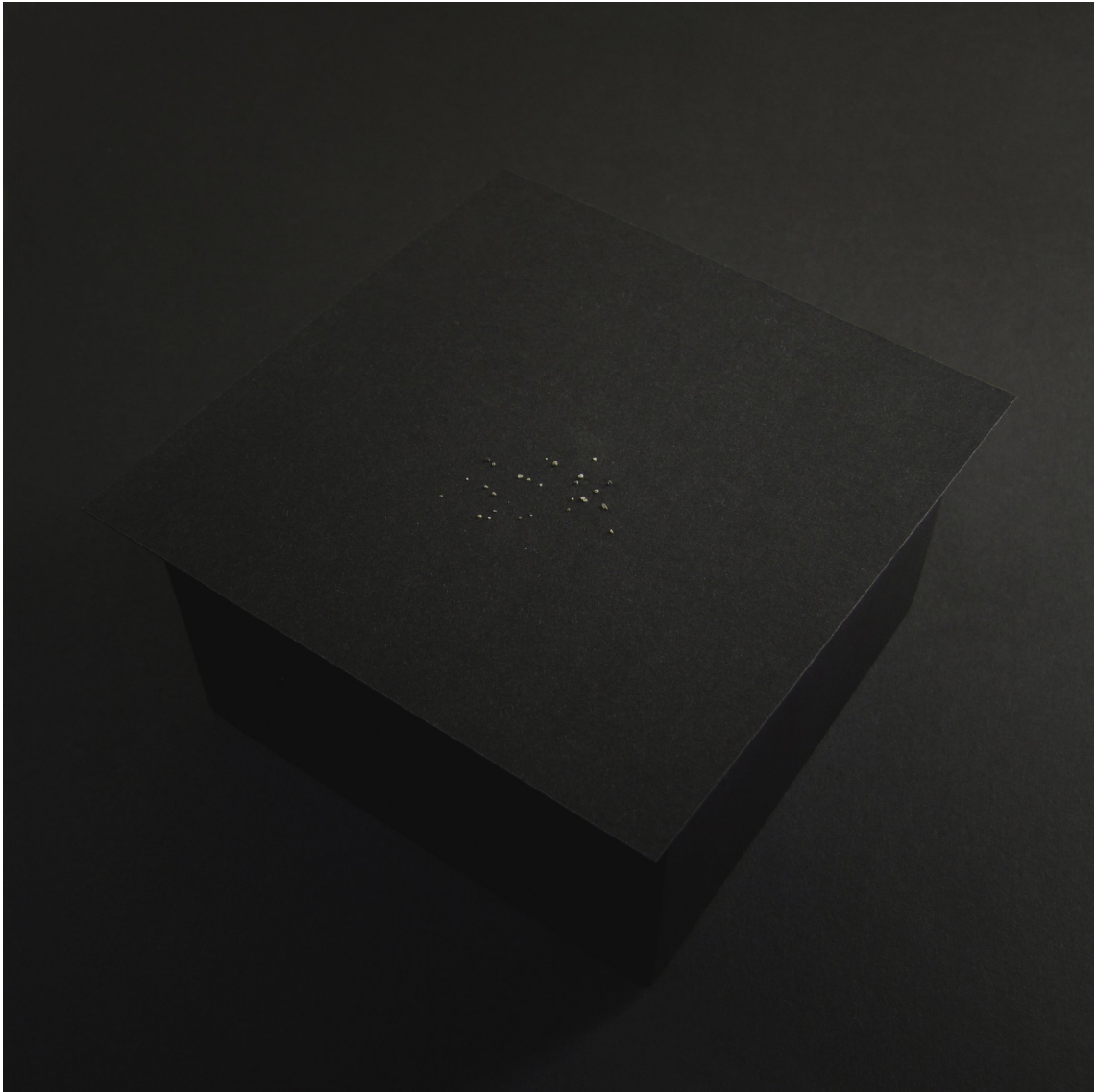
Caisson vibrant exposé à la Villa Henry : 3 Poussiérines , bois, papier, sable.